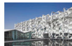
トバイ博日本館 クリエイティブアドバイザー