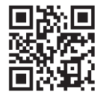
パノラマティクス webサイト