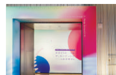
大阪中之島美術館1周年企画「デザインに恋したアート♡アートに嫉妬したデザイン」展

2023年よりグッドデザイン賞審査委員長。2025年大阪・関西万博EXPO共創プログラムディレクター。